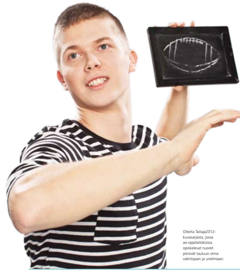
Otteita Taitaja2012-kuvasarjasta, jossa ao-oppilaitoksissa opiskelevat nuoret piirsivät tauluun omia valintojaan ja unelmiaan.

Kenen työkaluilla Suomen parhaat osaajat työskentelevät? Millä välineillä tulevat taitajat koulutetaan Suomessa? Rakenna tunnettuuttasi nykyisten ja tulevien ammattiosaajien parissa.