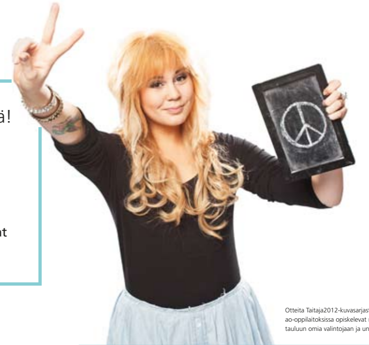
Ottietä Taitaja2012-kuvasarjasta, jossa as-oppilaitoksissa opiskellevat nuoret piirsivät tauluun omia valintojaan ja unelmiaan.