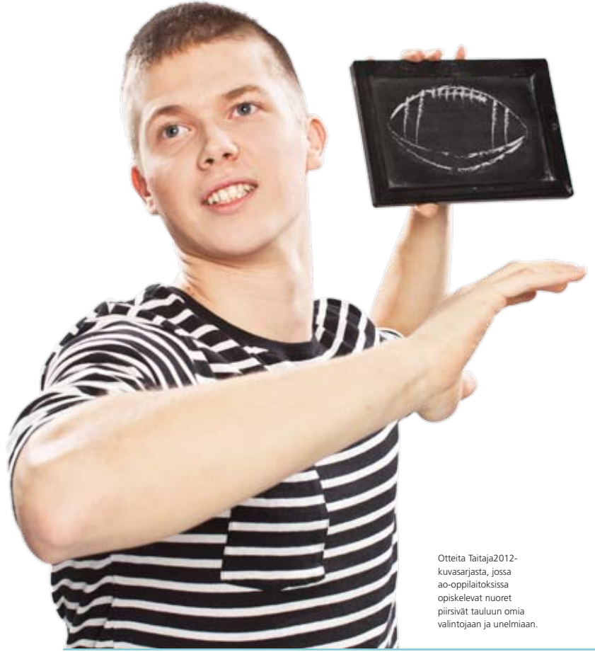
Otteita Taitaja2012-kuvasarjasta, jossa ao-oppilaitoksissa opiskelevat nuoret piirsivät tauluun omia valintojaan ja unelmiaan.

Kenen työkaluilla Suomen parhaat osaajat työskentelevät? Millä välineillä tulevat taitajat koulutetaan Suomessa? Rakenna tunnettuuttasi nykyisten ja tulevien ammattiosaajien parissa.